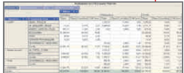
Κερδοφορία ανά Κατηγορία Πελατών και Γεωγραφική Ζώνη