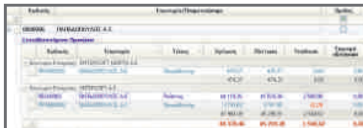
Διεταιρικό Ισοζύγιο Συναλλασσομένου